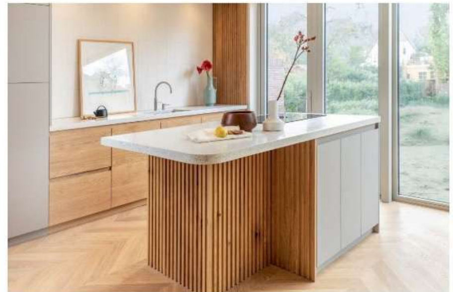
Keukenontwerp van Houtwerff