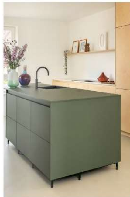
Ontwerp van Houtwerff