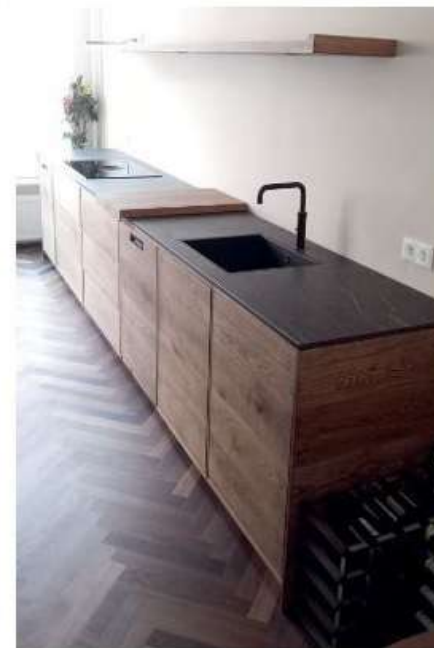
Ontwerp van Nienke Verschuur